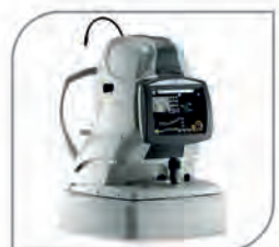
Retina Scan Duo-OCT (Nidek, Japan)