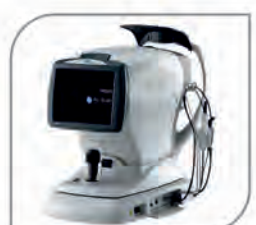
AL Scan- Optical Biometry (Nidek, Japan)