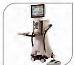
Centurion- Phacoemulsification Machine with Active Fluidics (Alcon, USA)