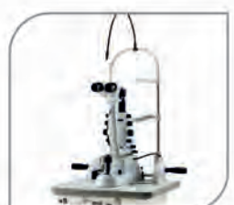
Slit Lamp (Nidek, Japan)