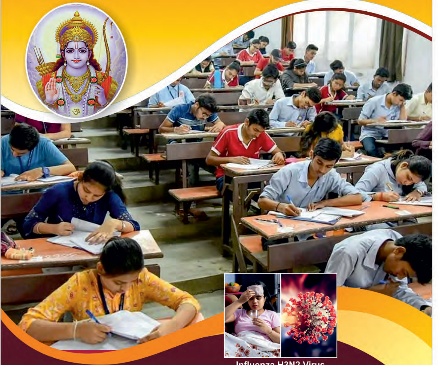
Influenza H3N2 Virus

પ્રકાશક : ખડાયતા જ્યોતિ પ્રકાશન સોસાયટી અ.સૌ. જયાબેન ચંદ્રકાન્ત સરૈયા સદન, જી-૨, મંથન એપાર્ટમેન્ટ, પુષ્પકુંજ સોસાયટી, લવ કોમ્પ્લેક્સના ખાંચામાં, કાંકરીયા, અમદાવાદ-૩૮૦ ૦૨૮ ખડાયતા જ્યોતિ : (૦૭૯) ૨૫૪૩ ૩૮૦૨ ખડાયતા કેળવણી મંડળ : (૦૭૯) ૨૫૪૩૦૮૦૧ website : www.khadayatajyoti.org