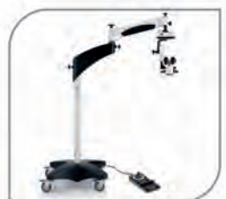
Operating Microscope (Leica, Germany)