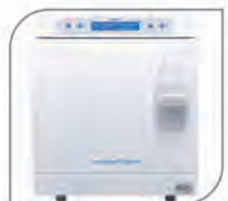
Autoclave Machine ClassB (Melag, Germany)