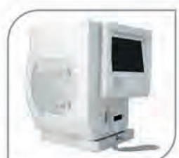
Visual Field Perimeter (ZEISS)

MONDAY - SATURDAY 08:30 AM - 9:30 AM (With Appointment) 05:30 PM - 8:00 PM