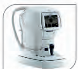
Non Contact Tonometer (Nidek, Japan)